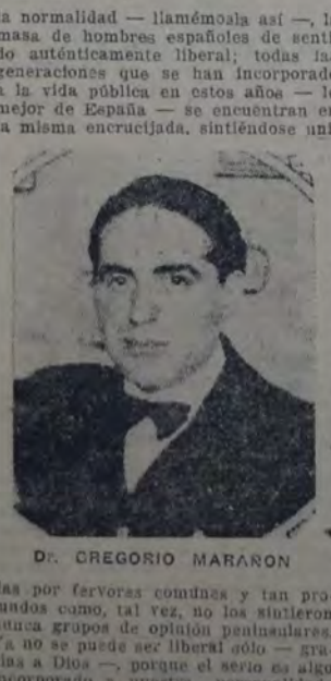
Dr. GREGORIO MARAON

Hace poco transcribimos en estas columnas una declaración del doctor Gregorio Maraón, en la que este conocido médico español hacía juicios y sensatos comentarios sobre la situación política de su país.