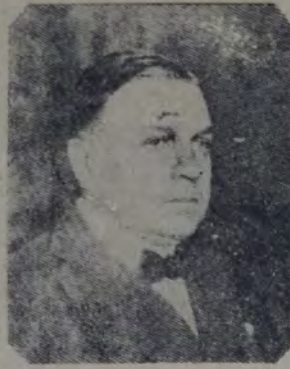
GENERAL ENRIQUE MOSCONI